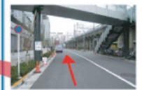
交差点を左折して約100m直進